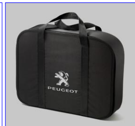
Taška na nabíjacie káble Peugeot 98 493 006 80