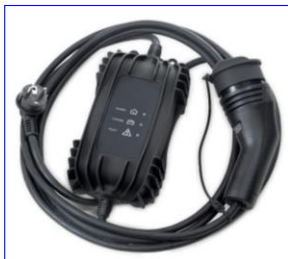
Štandardný kábel pre zapojenie do domácej 230V zásuvky 98 467 444 80