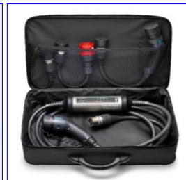
Súprava s nabíjacou jednotkou pre zapojenie do viacerých druhov elektrickej siete (230V/400V/WallBox) 98 460 313 80