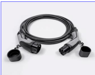
Kábel režimu 3 pre pripojenie do nabíjacej stanice (domáceho WallBoxu alebo verejnej stanice)