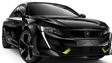
Čierna PERLA NERA