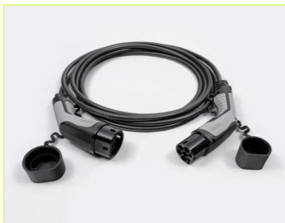
Kábel režimu 3 pre pripojenie do nabíjacej stanice (domáceho WallBoxu alebo verejnej stanice)