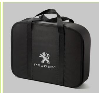
Taška na nabíjacie káble Peugeot 98 379 450 80