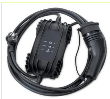
Štandardný kábel pre zapojenie do domácej 230V zásuvky 98 444 688 80