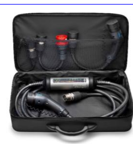
Súprava s nabíjacou jednotkou pre zapojenie do viacerých druhov elektrickej siete (230V/400V/WallBox) 98 460 313 80