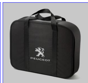
Taška na nabíjacie káble Peugeot 98 493 006 80