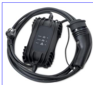
Štandardný kábel pre zapojenie do domácej 230V zásuvky 98 467 444 80