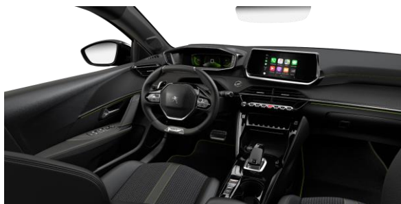
GT - Poťah sedadiel CAPY