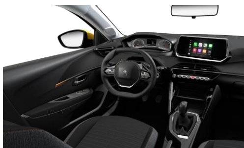
ACTIVE - Poťah sedadiel PNEUMA 3D