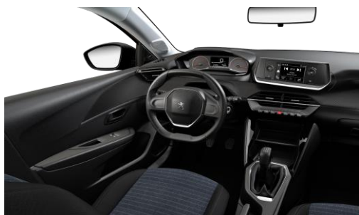
LIKE - Poťah sedadiel PARA