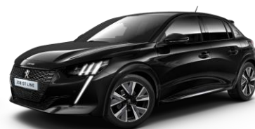
Čierna Perla Nera