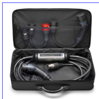
Súprava s nabíjacou jednotkou pre zapojenie do viacerých druhov elektrickej siete (230V/400V/WallBox) 98 460 313 80