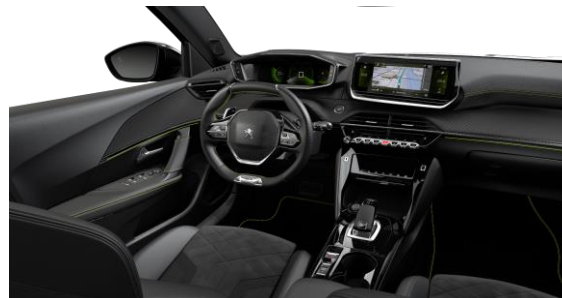
GT PACK - Poťah sedadiel ALCANTARA