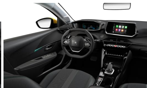
ALLURE - Poťah sedadiel COZY