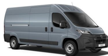
Sivá Iron - metalická