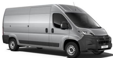
Sivá Artense (Steel) - metalická