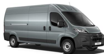
Sivá Tonnere (GRIS THUNDER) - pastelová