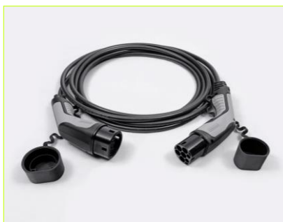
Kábel režimu 3 pre pripojenie do nabíjacej stanice (domáceho WallBoxu alebo verejnej stanice)