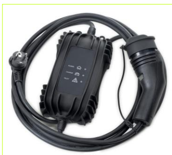
Štandardný kábel pre zapojenie do domácej 230V zásuvky 98 444 688 80