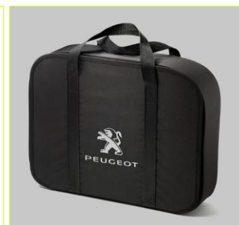
Taška na nabíjacie káble Peugeot 98 379 450 80