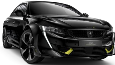
Čierna PERLA NERA