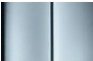
Réf. : COLOR_4FM0 Sivá Artense