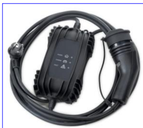
Štandardný kábel pre zapojenie do domácej 230V zásuvky 98 444 688 80