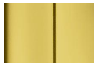
Žltá Carioca - matná*