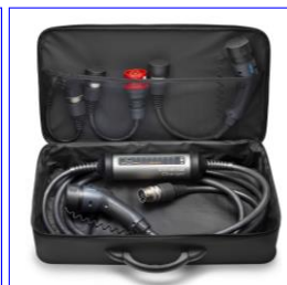
Súprava s nabíjacou jednotkou pre zapojenie do viacerých druhov elektrickej siete (230V/380V/WallBox) 98 357 837 80