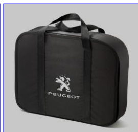
Taška na nabíjacie káble Peugeot 98 379 450 80