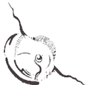
V tvare ½ bubliny a hviezdiky