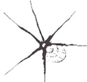
V tvare hviezdy