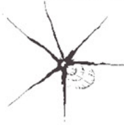
V tvare hviezdy