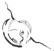
V tvare ½ bubliny a hviezdčky